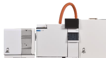
JMS-Q1600GC UltraQuad™ SQ-Zeta w/ MS-62071STRAP

GCキャリアガスとして広く使われている「ヘリウム(He)」は、様々な事情により、一時的な価格の上昇やその供給状態の不安定化等の問題を抱えることがあり、供給の遅滞等が発生した場合には一時的に代替ガスとして別種キャリアガスの使用の検討を迫られる場合がある。ヘリウムの代替ガスとしては主に水素と窒素が検討されており、特に水素は、最適な分離を行える線速度域が広く、GCキャリアガスとしては適している。今回ヘリウムの代替として水素をキャリアガスに使用し、厚生労働省が定める水質基準に相当する揮発性有機化合物(VOC)を対象として、ヘッドスペース(HS)-GC/MS法により測定を試みた。その結果、良好な再現性と検出感度を示すデータを得ることができたので報告する。