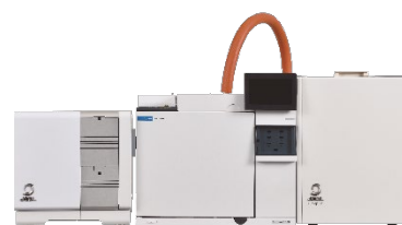
JMS-Q1600GC UltraQuad™ SQ-Zeta w/ MS-62071STRAP

GCのキャリアガスとして広く使われているヘリウム(He)は、様々な事情により、一時的な価格の上昇やその供給状態の不安定化等の問題を抱えることがある。He供給の遅滞等が発生した場合には代替ガスとして別種のキャリアガスの使用検討が必要になる。代替ガスとして主に水素と窒素が検討されており、水素は最適な分離を行える線速度域が広く、GCのキャリアガスとして適しているが、可燃・爆発の恐れから扱いに注意を要する。このため安全性を重視した場合、窒素ガスの方がGC-MSへの導入が比較的容易である。今回、ヘリウムの代替として窒素をキャリアガスに使用し、水質基準に関する省令により定められている水道水質基準および水質汚濁に係る環境基準において基準値が定められている揮発性有機化合物(VOC)について、ヘッドスペース(HS)-GC-MS法による測定を試みた。その結果、良好な再現性と検出感度を示すデータを得ることができたので報告する。